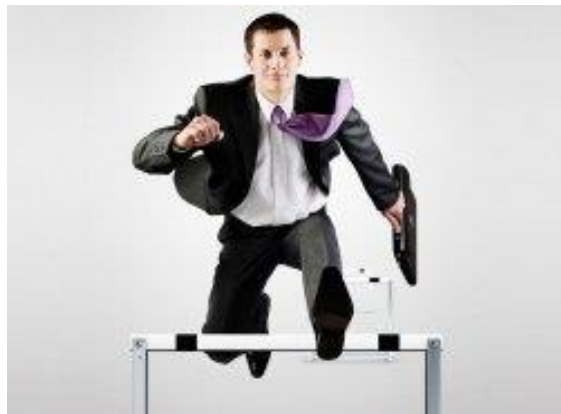
Устранение административных барьеров