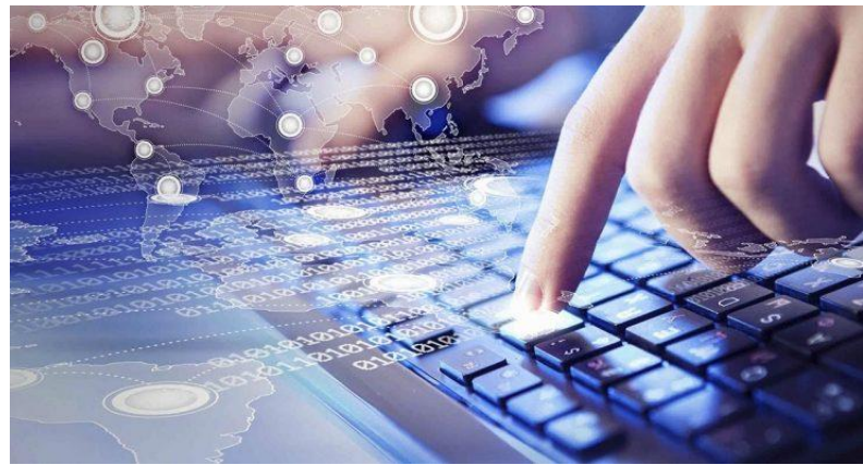
Цифровизация общественных процессов