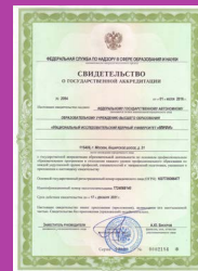
АККРЕДИТАЦИЯ № 2084 от 01.07.2016

МИФИ НАЦИОНАЛЬНЫЙ ИССЛЕДОВАТЕЛЬСКИЙ ЯДЕРНЫЙ УНИВЕРСИТЕТ