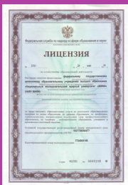
ЛИЦЕНЗИЯ №2151 от 24.05.2016