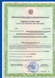
АККРЕДИТАЦИЯ № 2084 от 01.07.2016

МИФИ национальный исследовательский ЯДЕРНЫЙ УНИВЕРСИТЕТ