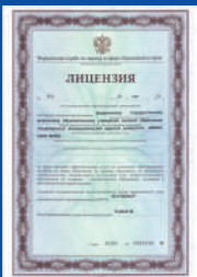
ЛИЦЕНЗИЯ №2151 от 24.05.2016